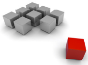
TABLE DES MATIÈRES